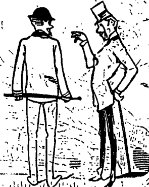
DEVANT LE TERRAPIN.