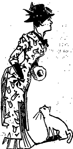
Fleurs de printemps.