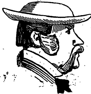
Un homme heureux.