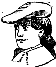
Une jeunesse qui promet.