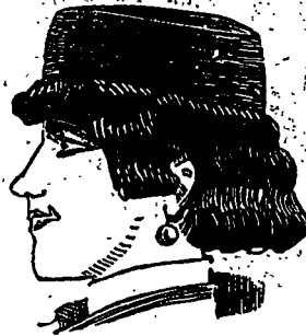
C'est selon les goûts !