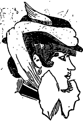
Ne manque pas de chic !