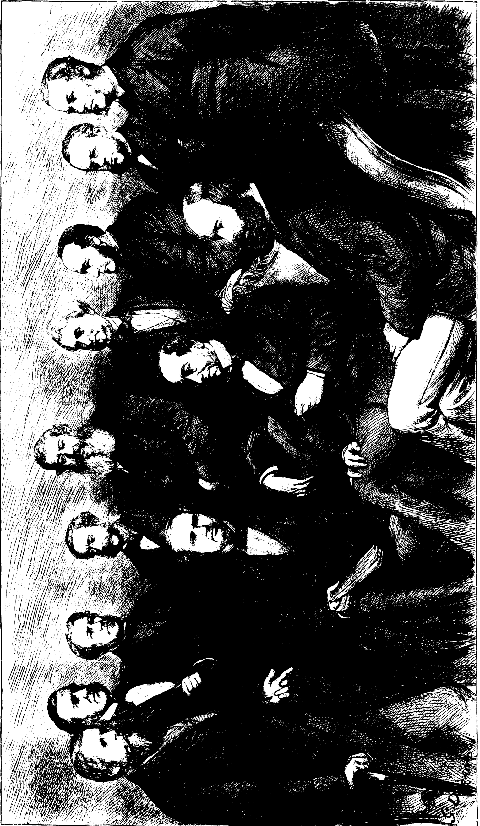
LE CABINET DISRAELI.