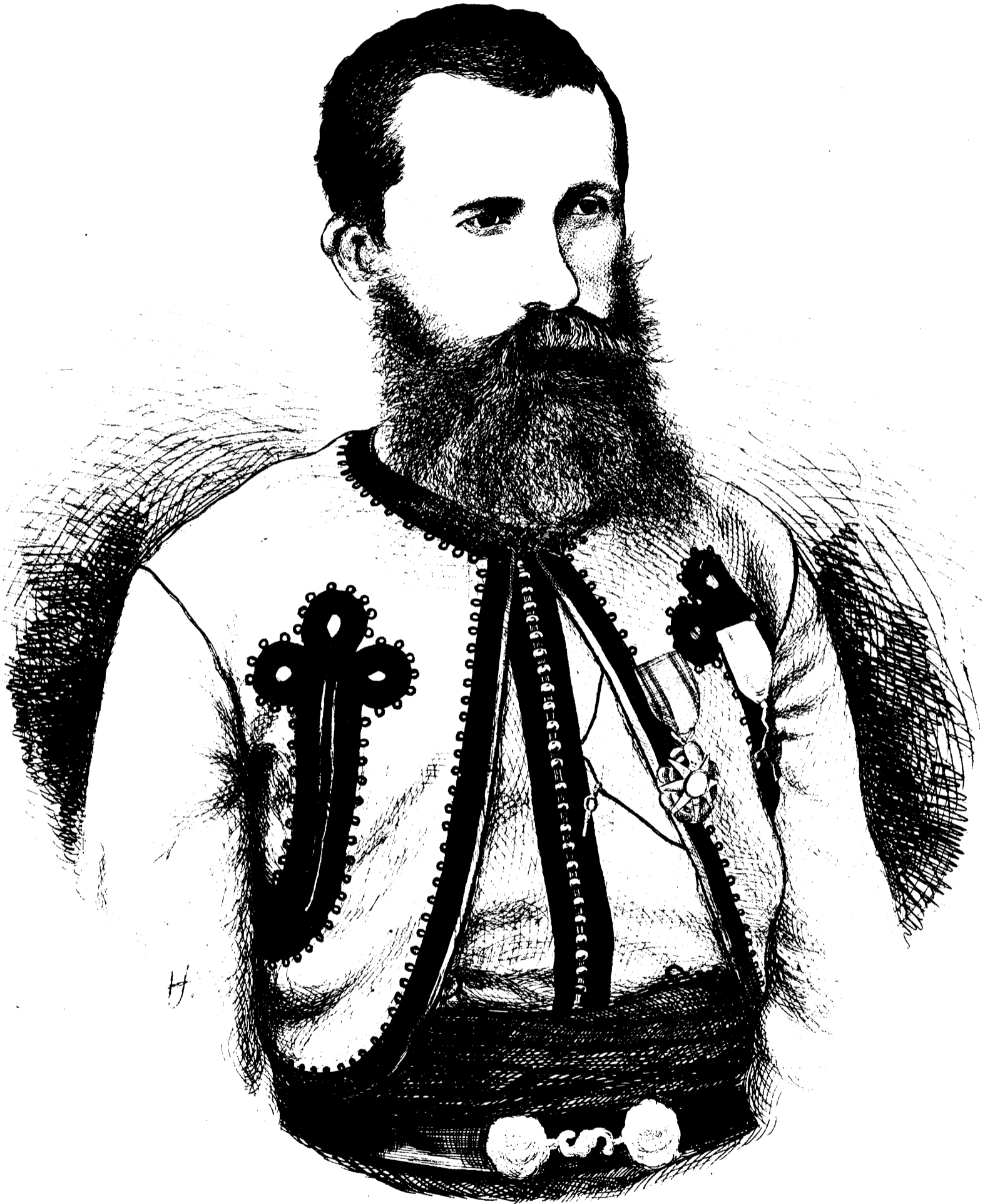
HUGH MURRAY, SOUS-LIEUTENANT AUX ZOUAVES-PONTIFICAUX.