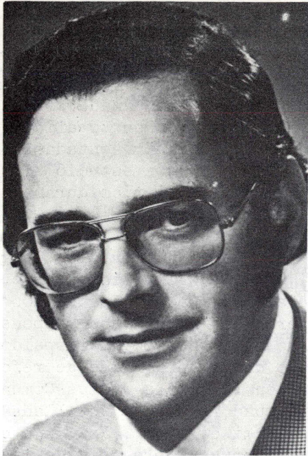
El Procurador General Francis Fox

penal con miras a ofrecer un mayor número de alternativas al encarcelamiento, el Sr. Fox dijo que se estaban examinando las medidas pertinentes al caso sobre una base de prioridad. Asimismo y con miras a "establecer operaciones correctivas uniformes en todo el país", se habían celebrado varias reuniones de ministros federales y provinciales y se había creado un comité de trabajo. El Comité Permanente de Subsecretarios informaría sobre el avance de los trabajos en la próxima conferencia de ministros.