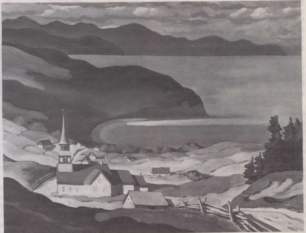
Paysage de Charlevoix, Jean-Paul Lemieux, huile sur toile, 1935.