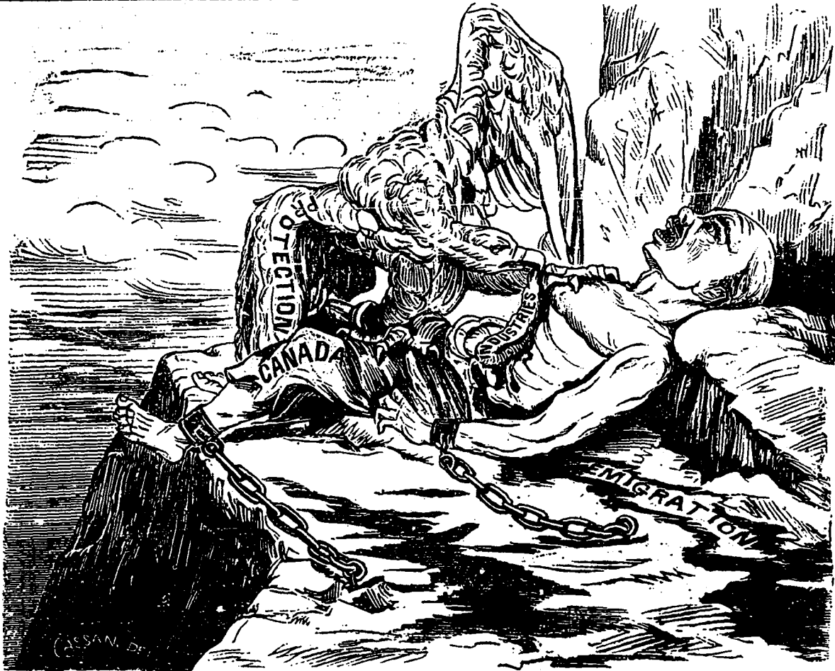
PROMETHÉE CANADIEN EN PROIE AU VAULTOUR DE LA PROTECTION.