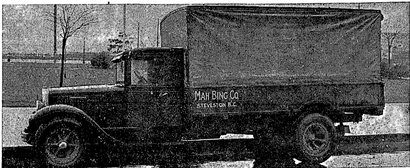
之國 際 貨 車 圖

江門函 江門出口品物 向以柑葉葵扇等類出產最為大宗 全邑商戶 均賴此項金融為週轉 詎今年天氣不佳 常有霧落 以致果中 禮樂 外海等鄉柑葉 多被限落 收穫甚少 且今年柑價大跌 各農民無不憂形於色