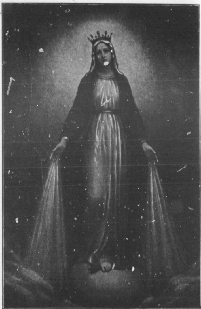
Béni soit la sainte immaculée et très pure conception de la bienheureuse Vierge Marie, Mère de Dieu. (300 jours d'indulgence).

es in ba On cri le qu vo int à po La pe sou ces cri bes vé