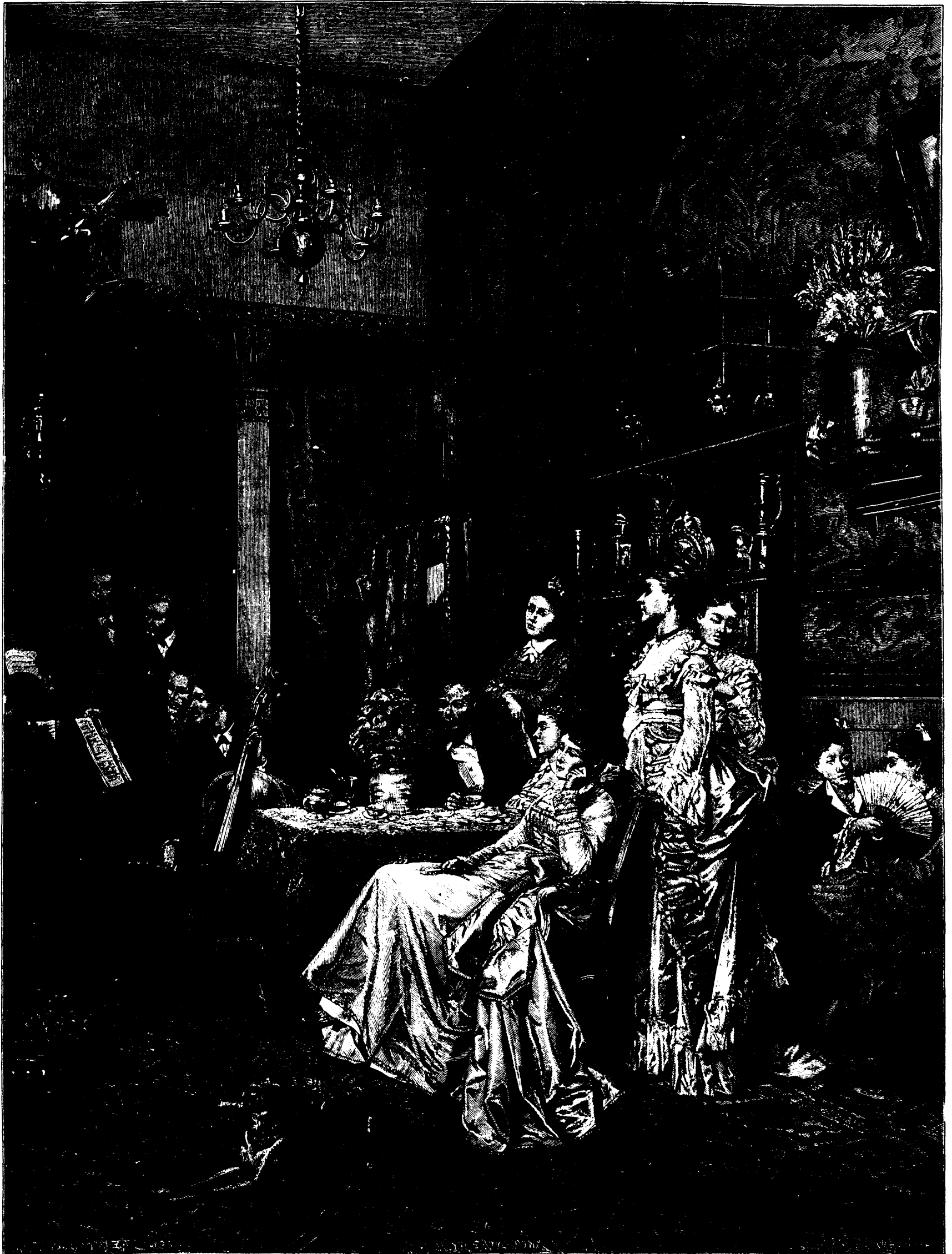
UN CONCERT D'AMATEURS DANS UN ATELIER D'ARTISTE—D'APRÈS ADRIEN MOREAU