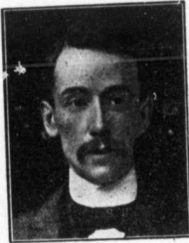
M. L. A. TASCHEREAU, avocat, Député de Montmagny, Québec.