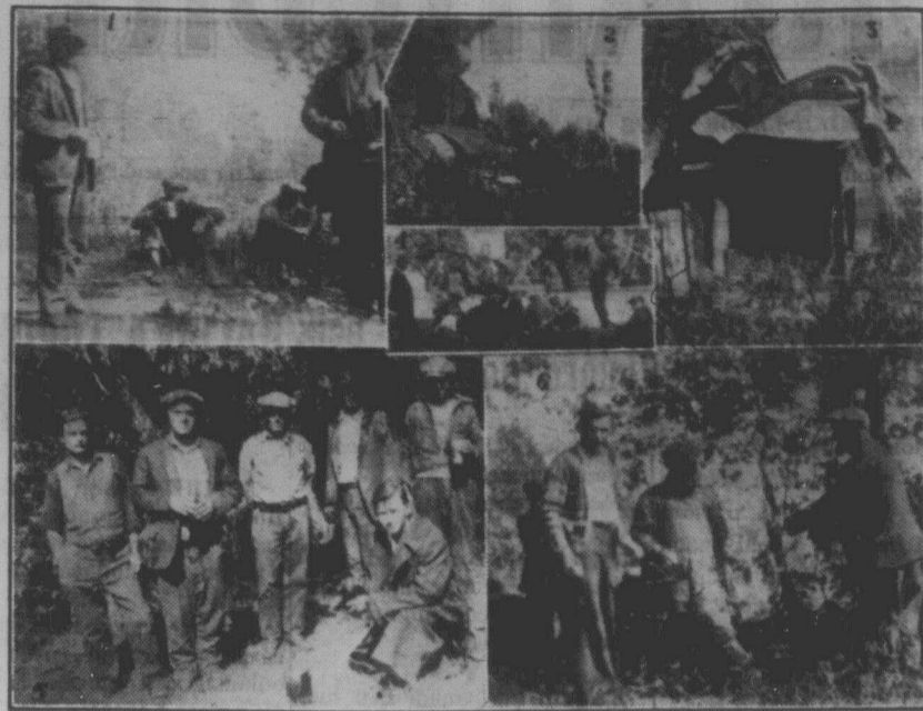
Безробітні в "Гобо парку" у Вінніпегу: 1. "обідають", пють "чай" з бляшанок; 2. поправ і сушитися на рікю, накинувши на голі плечі ковта; 3. "помешкання"; 4. "конференція"; 5. "вистроїлися" до фотографії; 6. пригтовляють "обід".

"Гобо парк" — є такий у Вінніпегу і я певний, що цього літа є такі "парки" по всіх містах Канади.