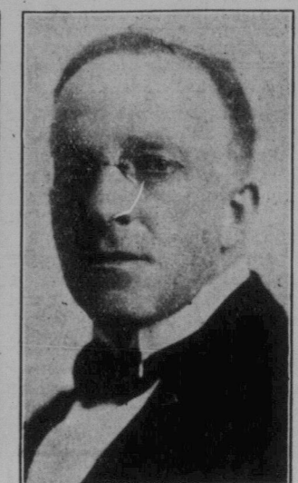
מאדראס היימאן מעיאד וועב