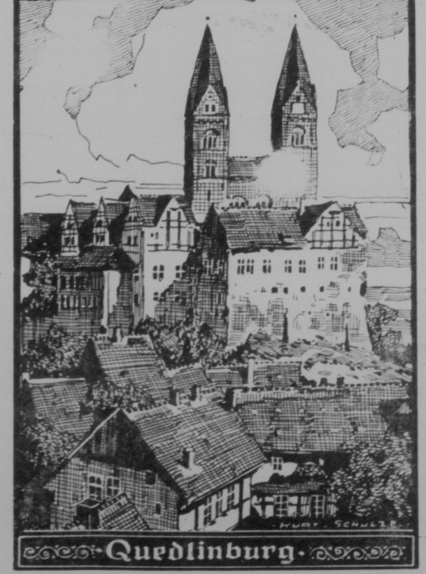
Quedlinburg am Harz