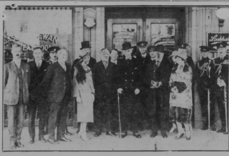
Generalgouverneur von Canada ...