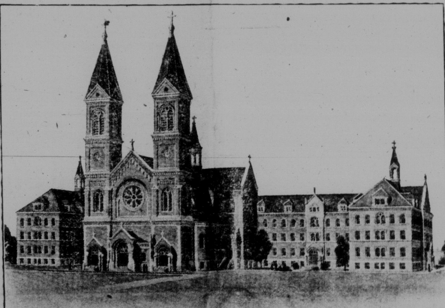
ST. PETER'S COLLEGE, as it will proudly stand.