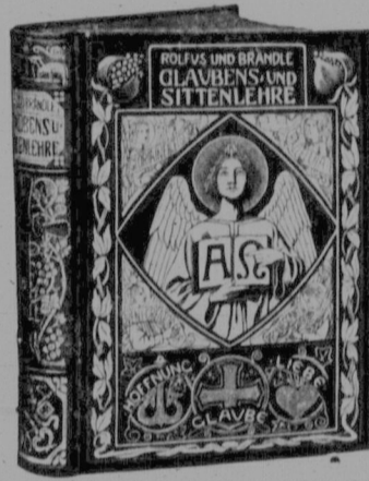
Einband zu Rollus, Glaubens- u. Sittenlehre.