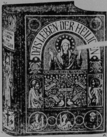
Einband zu Bittmann, Leben d. Heiligen.