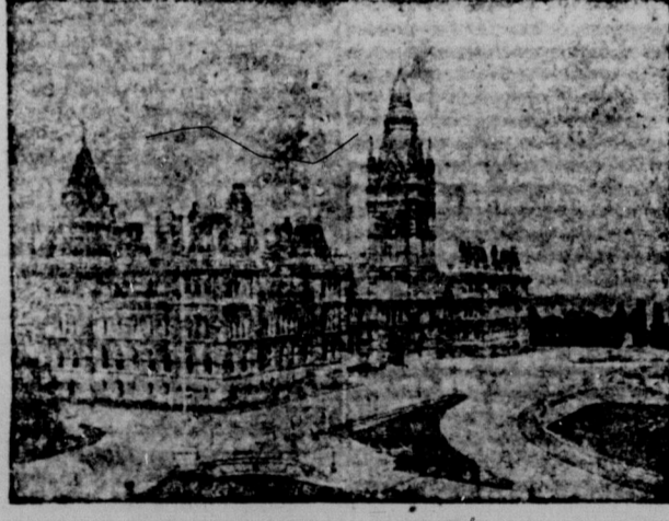
Parlamentsbyggnaden i Ottawa.

Härjadt pappersbruk. Från St. John, Nfld., meddelas, att Harnsworth pappersbruk vid Grand Falls, som turnerar Lord Northbills tidningar med papper, i onsdags härjades af eld. Förlusten belöper sig antagligen till $100,000. Atervända hem. Den amerikanska Röda korsafdelning, som arbetat i Ryssland, är nu på väg hem till Förenta Staterna. Den afsäglade i onsdags från Bergen, Norge. Det uppgives, att Ryssland icke längre behöfver främmande läkarsjäl. Antager Filipinern. Senaten i Washington antog i fredags Filipinern, hvarigenom Filipinerna erhålla självständighet inom fyra år och genast få utvidgad självstyrelse. Den antogs med 52 röster mot 24. Billen har ännu icke passerat representanthuset.