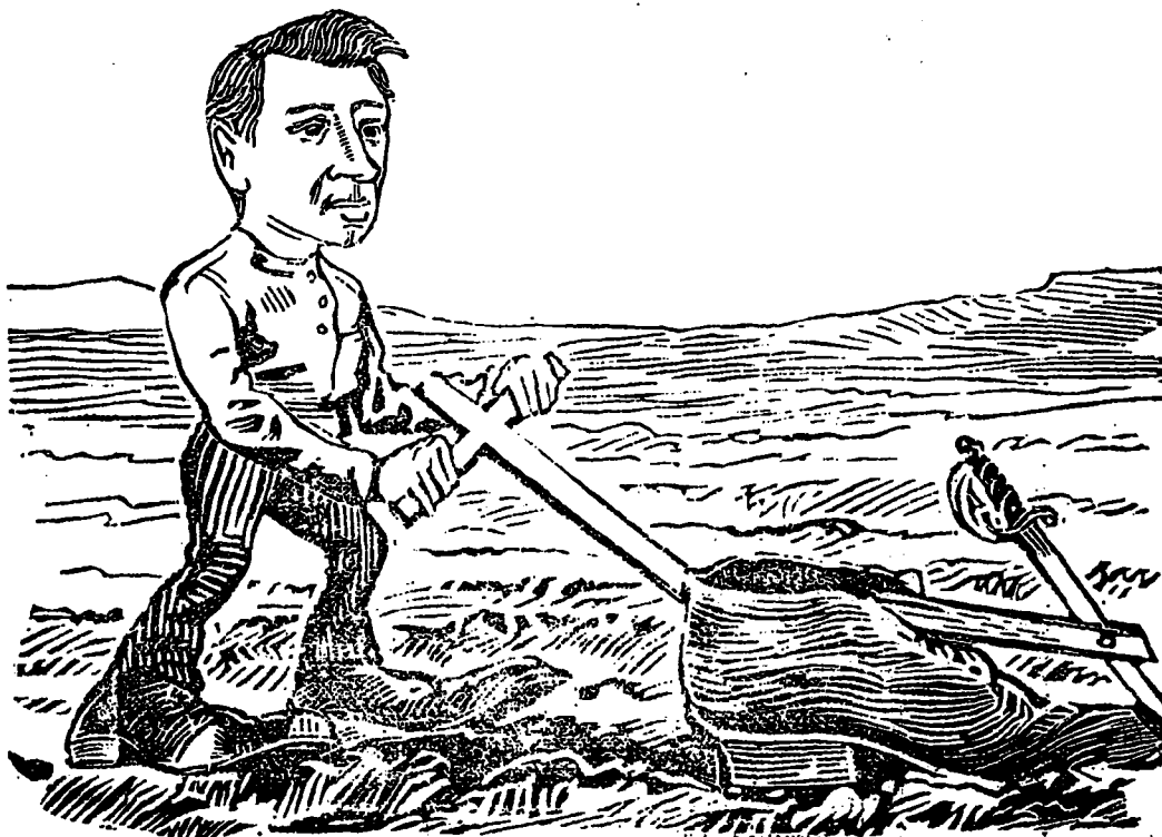
LA CHARRUE, LA CROIX ET L'ÉPÉE

Aujourd'hui, à la place des ruines s'élevaient de nouvelles constructions: ce ne sont plus ces vieilles maisons gothiques, aux clochetons aigus, aux mille et une fenêtres s'étagant sur les grands toits à pic, aux profondes arcades remplissant les intérieurs d'une ombre monotone. On les a remplacés par d'élégants hôtels où s'entassaient et se confondaient l'officier prussien aux allures hautesaines, le touriste anglais à la morgue indifférente, le voyageur français à la lèvre