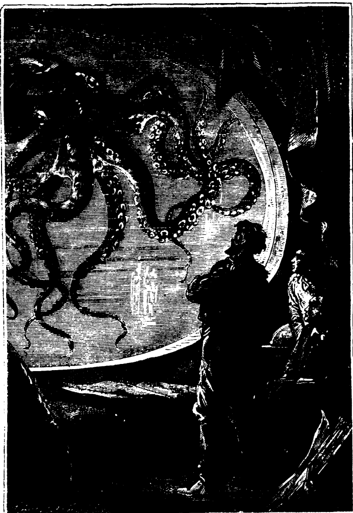
C'était un calmar de dimensions colossales (p. 268, col. II.)

Ces rochers étaient tapissés de grandes herbes, de laminaires géants, de fucus gigan-