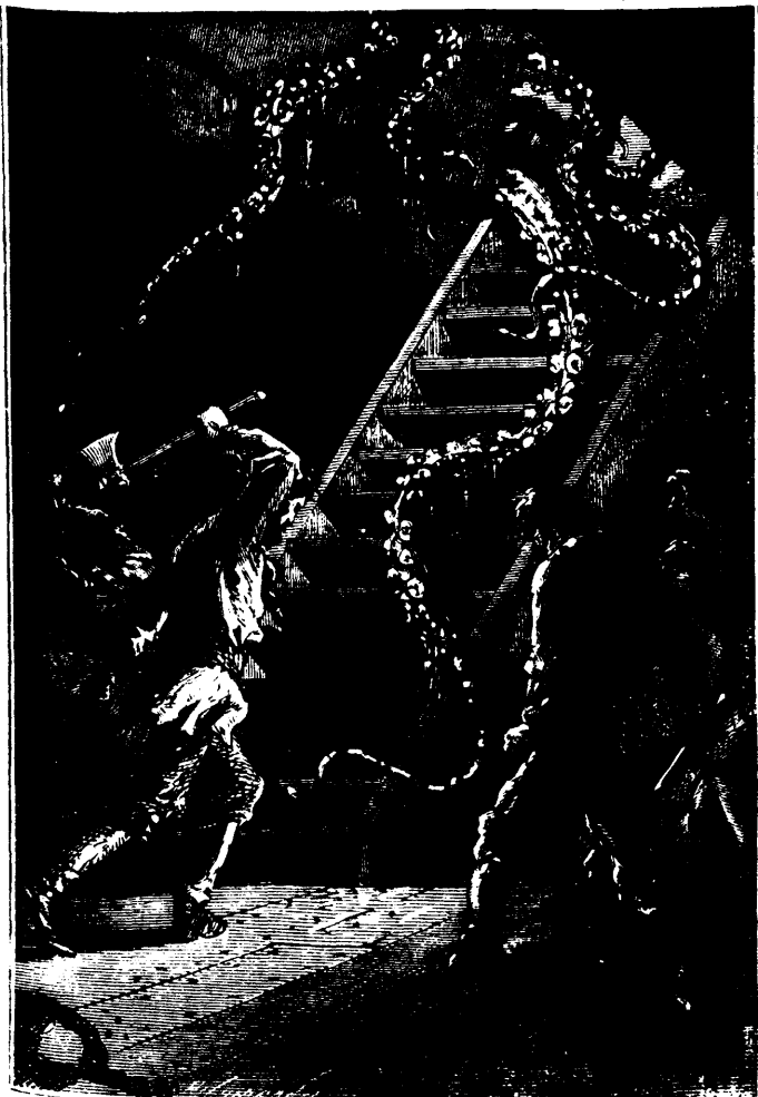
Un de ces longs bras glissa par l'ouverture (p. 268, col. III.)

Le Canadien, Conseil et moi, nous eûmes une assez longue conversa-