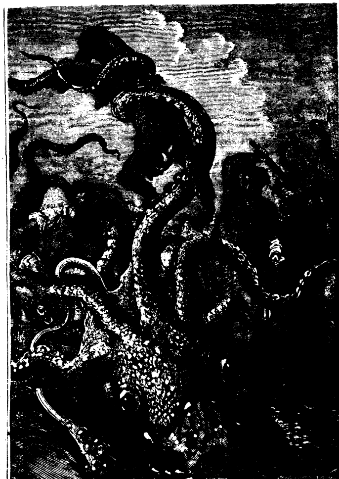
Le poulpe brandissait la victime comme une plume (p. 268, col. III.)

— Jamais on ne me fera croire, dit Ned Land, que de tels animaux existent.