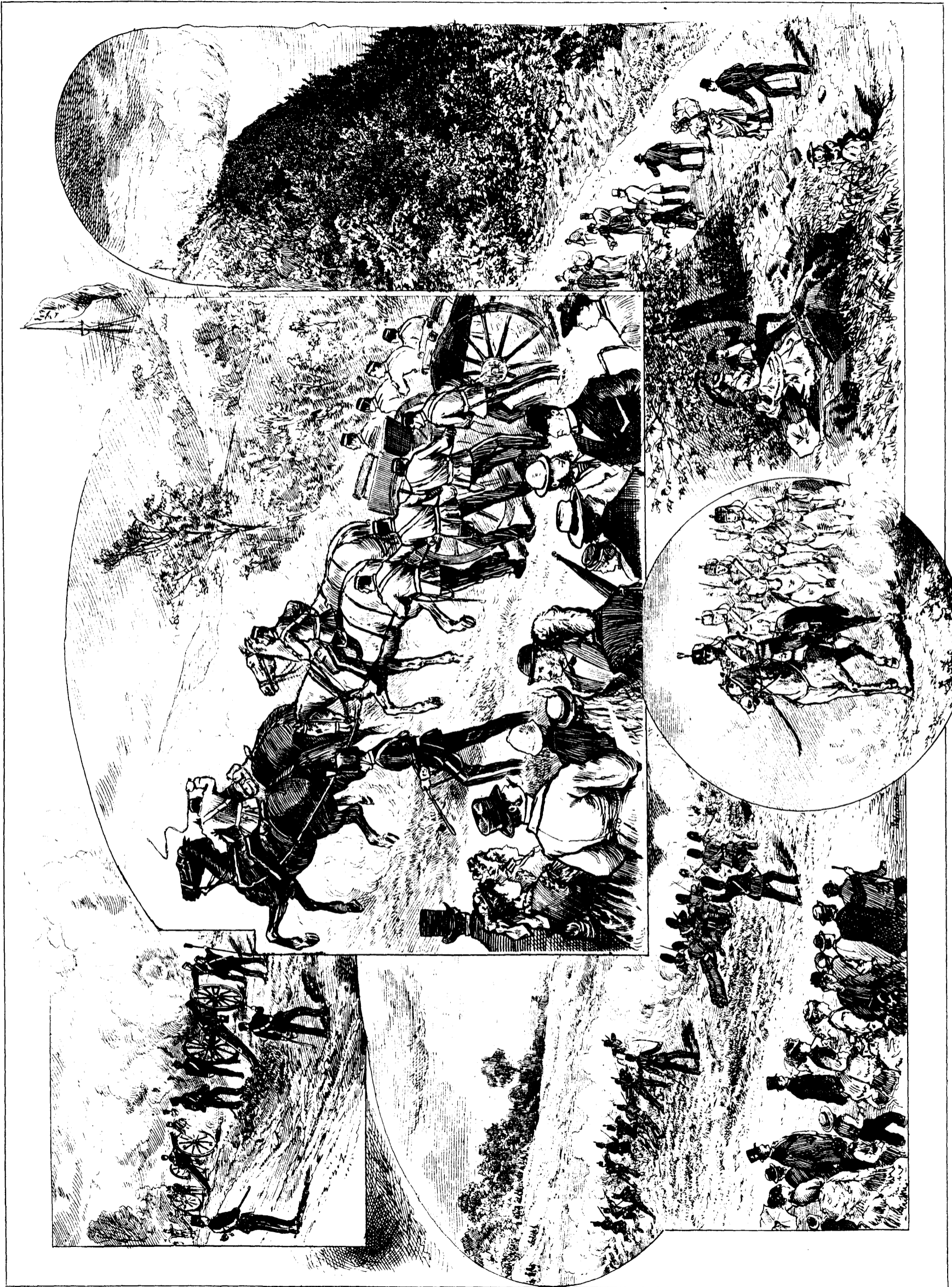
L'INAUGURATION DU PARC MONT-ROYAL, LE 24 MAI