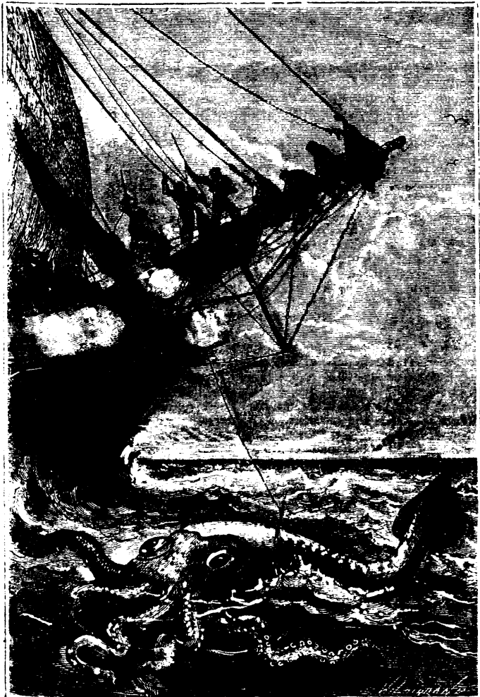
Il l'attaqua à coups de harpon (p. 268, col. I.)