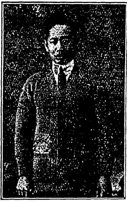
〔結 擇 定〕 法 之 尺 度

本公司在雲南華開張織造男女各款最好羊毛捲結工夫精良久為僑胞歡迎蓋本公司所織之捲結專取合中國人身材尺度適合非比西人所製之造有袖長及不襯身之憾而且價廉物美 兼售各種衣物額外克己