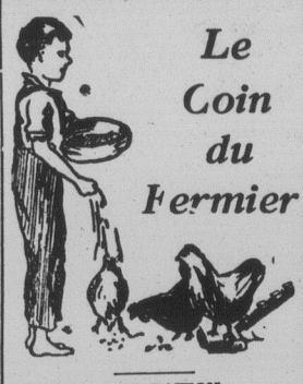
DONNONS UNE RATION BIEN EQUILIBREE