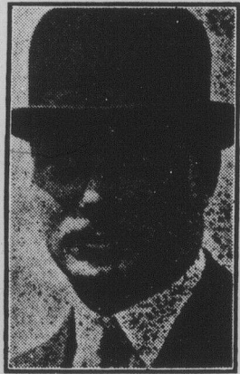
Le Duc de GLOUCESTER, 3e fils de Sa Majesté le roi George V, est l'auteur de "Big Game Shooting in Africa"; un ouvrage volumineux qui a remporté un grand succès récemment en Angleterre, et dans lequel il décrit ses aventures de chasse dans les jungles africaines.