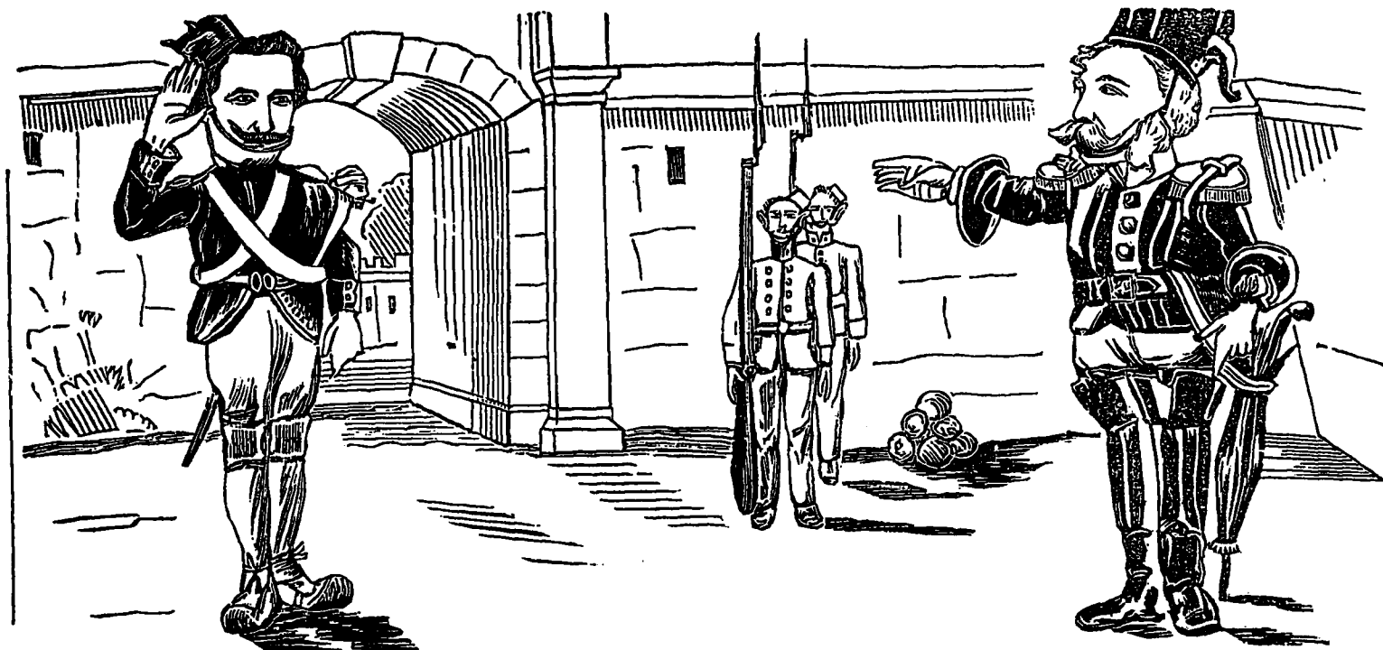
GRANDE REVUE DES FORCES LIBERALES.