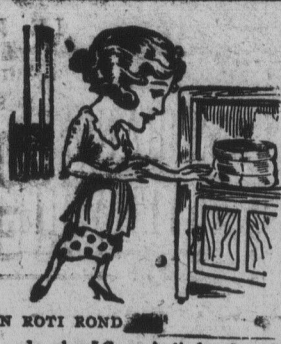
UN KOTI ROND de chez Campbell fera un dîner délicieux pour les hôtes invités de demain.