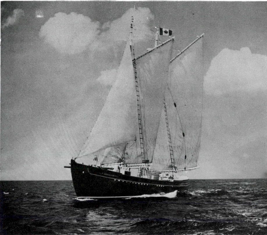
El Norma & Gladys a toda vela.