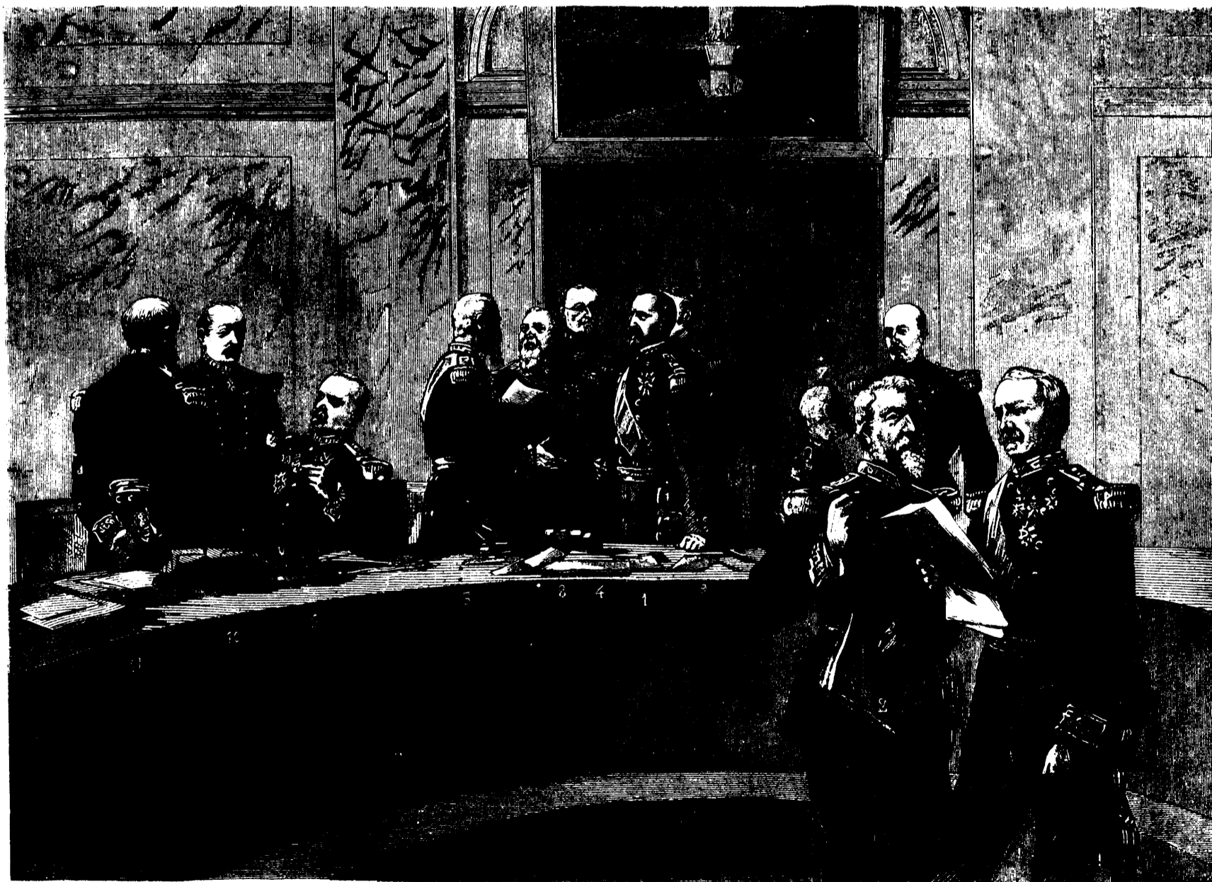
PROCÈS DU MARÉCHAL BAZAINE.—LES MEMBRES DU PREMIER CONSEIL DE GUERRE.

Ex-PRÉSIDENT DU GOUVERNEMENT PROVISOIRE, MANITOBA.