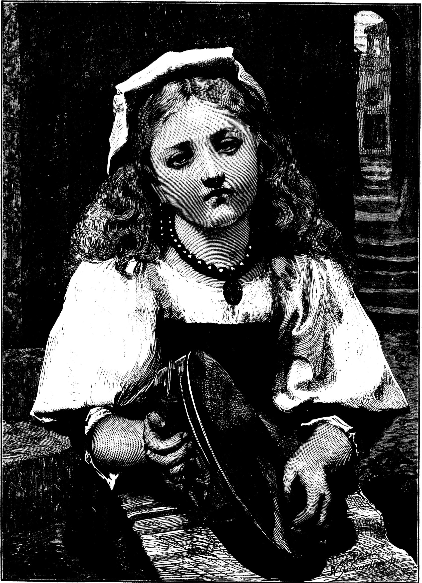
LA TAMBOURINE CASÉE.