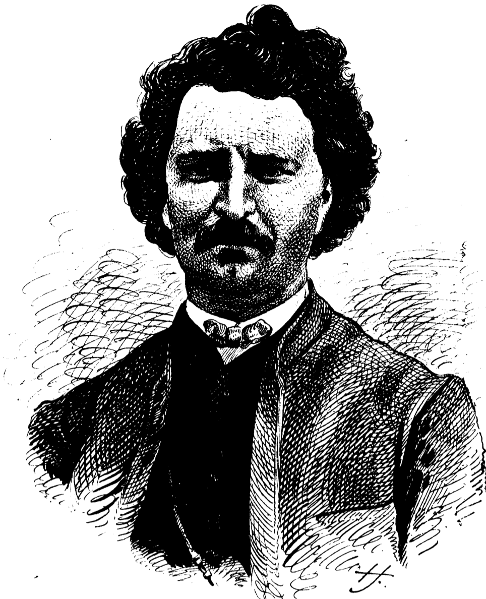
LOUIS RIEL, M. P.

Ex-PRÉSIDENT DU GOUVERNEMENT PROVISOIRE, MANITOBA.