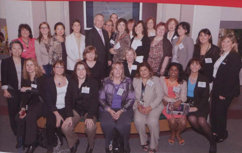
Le ministre du Commerce international Ed Fast lance le bulletin Les Femmes d'affaires en commerce international de 2012 lors d'une activité de la Women Presidents' Organization à Vancouver.