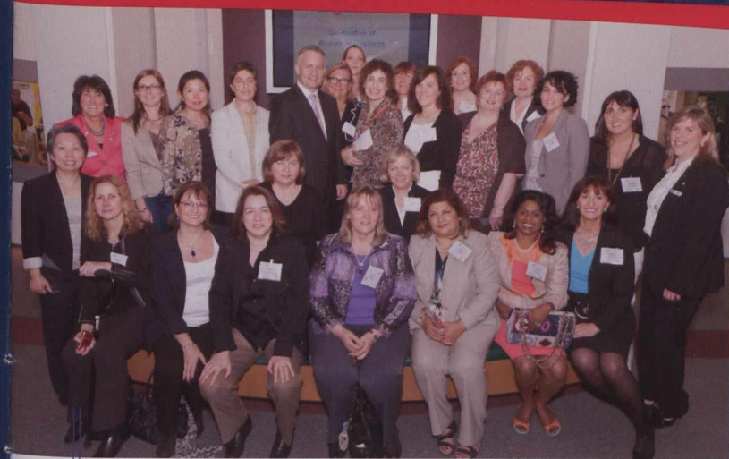
International Trade Minister Ed Fast launches the 2012 Business Women in International Trade newsletter at a Women Presidents' Organization event in Vancouver.