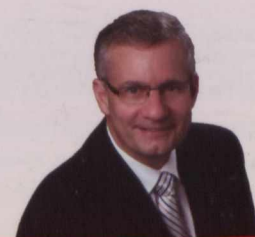
L'honorable Ed Fast Ministre du Commerce international

Les femmes d'affaires canadiennes sont dynamiques et elles exercent une grande influence dans bon nombre de secteurs de notre économie. Je leur souhaite tout le succès voulu dans les efforts qu'elles déploient pour tirer parti des débouchés sur la scène internationale et accélérer la croissance de leur entreprise à l'étranger.