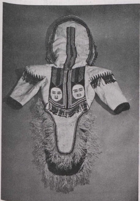
Wolfspelz-Anorak aus Aklavik