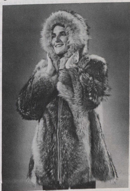
Ein "attigi", das ist ein Anorak aus umgedrehtem Karibufell, der unter einem zweiten Karibu-Anorak getragen wird; aus Baker Lake

Unter der Schirmherrschaft des Kanadischen Eskimo-Kunstrats (Canadian Eskimo Arts Council), einem Beratergremium des Ministeriums für Angelegenheiten der Indianer und die Entwicklung der Nordgebiete, ist