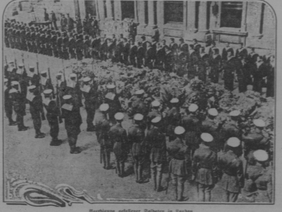
Bereitigung gefesselter Soldaten in Leoben

Die Weizenerte... (Continuation of the article.)