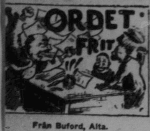
Från Buford, Alta.