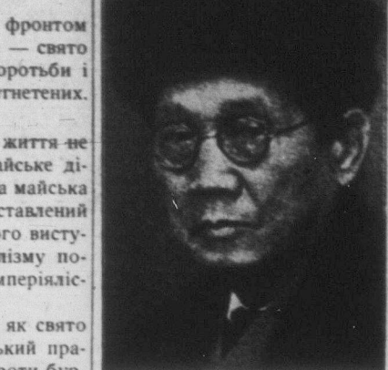
СЕН КАТАЯМА, провідник японських комуністів.

Тепер капіталістичні правительства і буржуазні зграї дають пролетаріатові кроваві лекції. Пролетарі Європи і Америки не можуть не боротись, если хочуть жити. Вони хочуть жити — тому неминучо повинні боротись за владу. Історія не дає їм вибору. Вона тільки каже: "Спішіть! Чим скорше, тим ліпше, тим легше справитесь з проклятим наслідством капіталізму!"