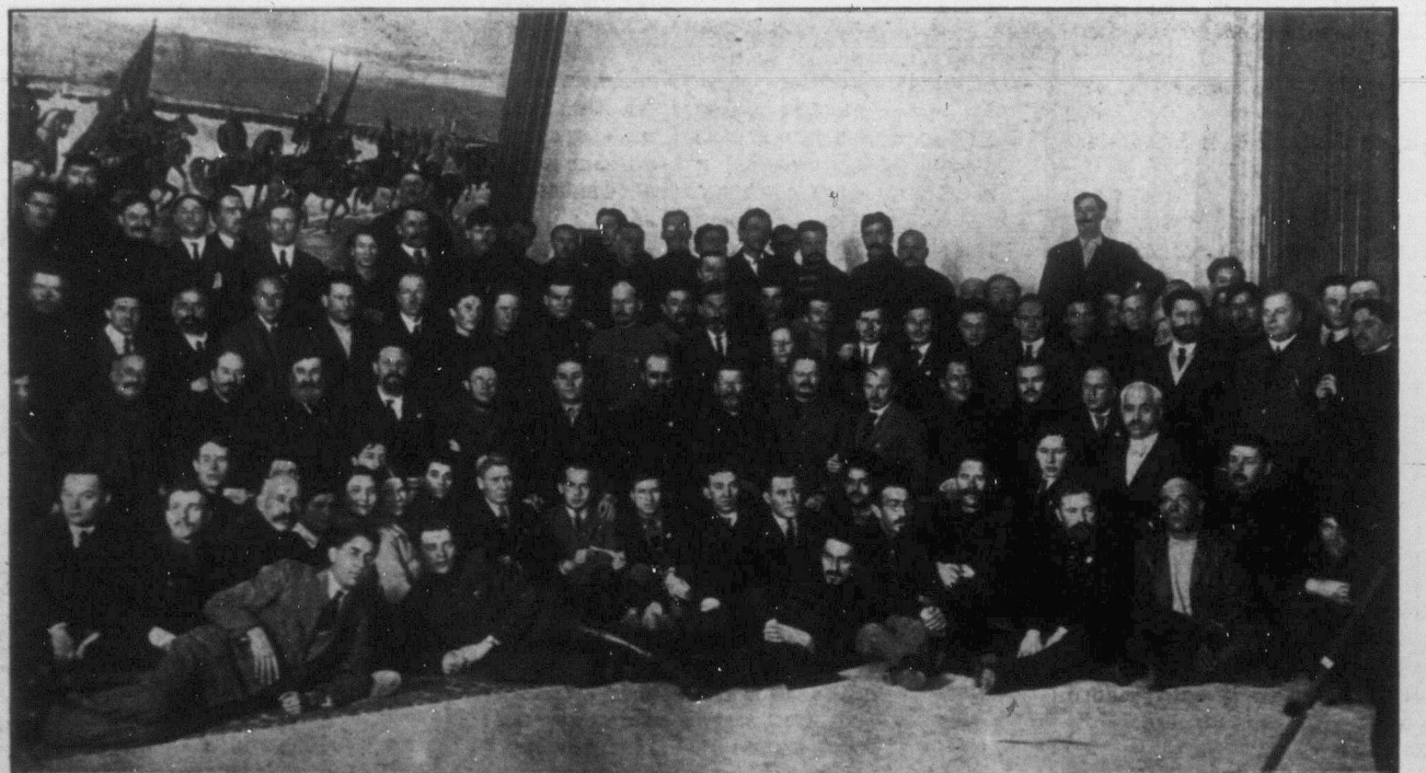
ДЕЛЕГАТИ РАДЯНСЬКИХ РЕПУБЛІК НА ІV. КОНГРЕСІ КОМУНІСТИЧНОГО ІНТЕРНАЦІОНАЛУ В МОСКВІ.

1. мая 1918 р. оголошення деклярації прав та обовязків працюючих. Німці заводили Севастополем. Російський та український радянські уряди звернулись до Румунії з домаганням очистити Бесарабію від румунських військ.