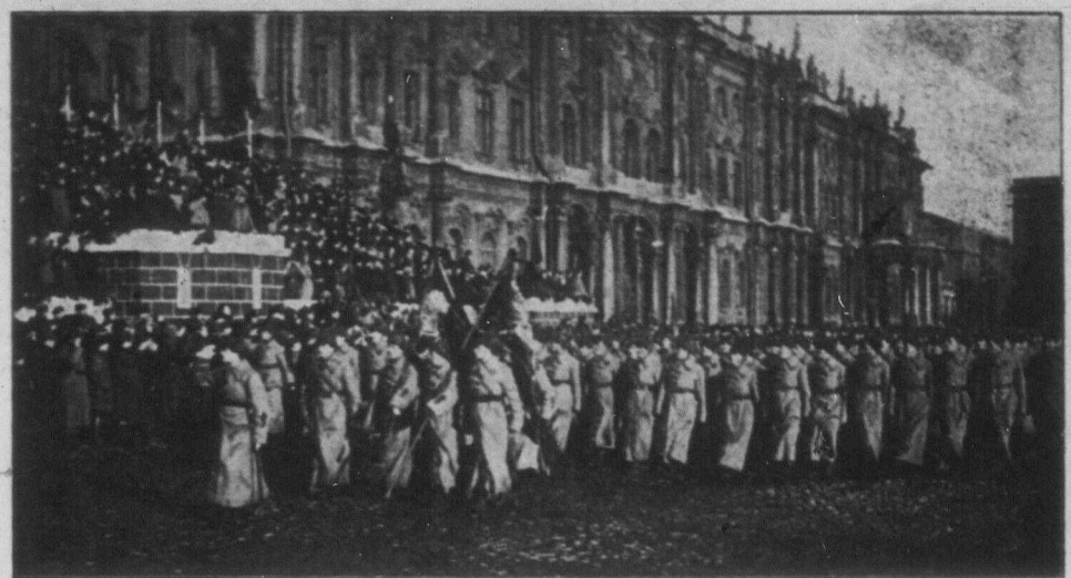
Полія червоноарміїшів на Червоній Площі в Москві підчас IV. Конгресу Комінтерна в листопаді 1922 р.