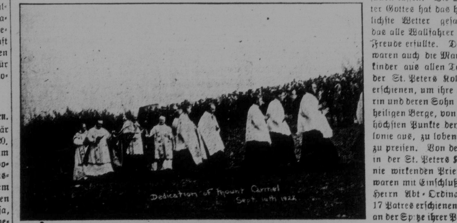
Die Weihe des Berges Carmel am 10. September 1922