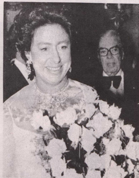
La Princesa Margaret y Paul Martin, Alto Comisario de Canadá en Londres, durante la gala real.

La actuación de gala real auspiciada por Northern Telecom recaudó más de 10.000 dólares para el Fondo de Desarrollo del Royal Opera House.