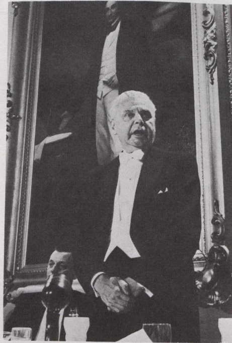
John Diefenbaker en frente de un retrato de John A. MacDonal, primer Primer Ministro de Canadá.

la más elevada mayoría obtenida por un gobierno desde la Confederación. El punto culminante de la carrera de Diefenbaker como Primer Ministro fue la adopción de la Ley Canadiense de Derechos Humanos en 1960.