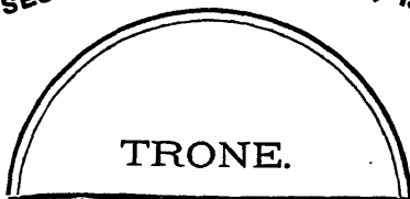
DIAGRAMME DE LA SALLE DU SENAT. 6 E SESSION, 7 E PARLEMENT, 1896.