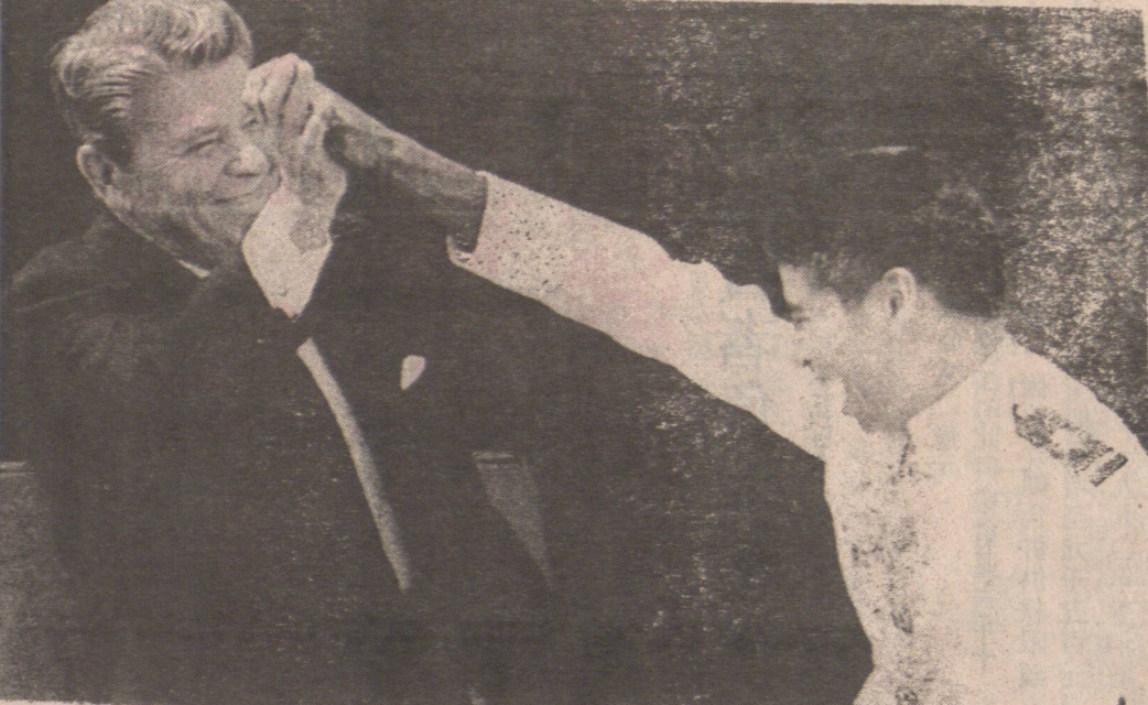
美國海軍學院一學生以一種特殊握手方式，向列根致敬。

【台維夫電】以色列政府已準備就緒，以釋放猶太恐怖份子。據悉，政府正與有關方面進行談判，以達成釋放協議。政府表示，將根據國際法定的原則，處理此事。目前，談判仍在進行中，雙方都表現出了誠意。