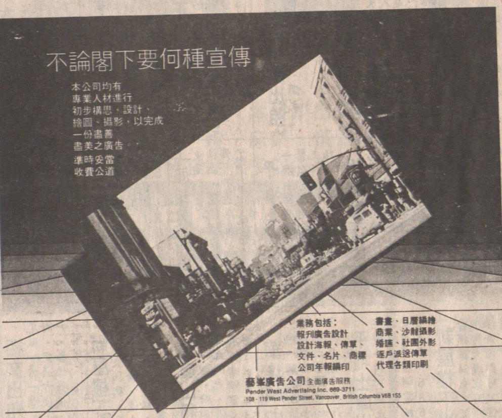
不論閣下要何種宣傳

本公司均有專業人材進行初步構思、設計、繪圖、攝影，以完成一份盡善盡美之廣告，準時交貨，收費公道。