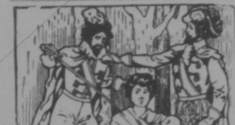
Das Buch Genoveva

St. Marien Kirche (Evang. luth.): Gottesdienst jeden Sonntag um 10 Uhr. St. Pauli Kirche (Evang. luth.): Gottesdienst jeden Sonntag um 10 Uhr. St. Michaels Kirche (Evang. luth.): Gottesdienst jeden Sonntag um 10 Uhr.