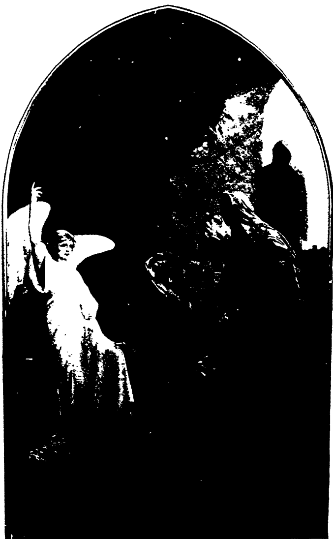
LES SAINTES FEMMES AU TOMBEAU.