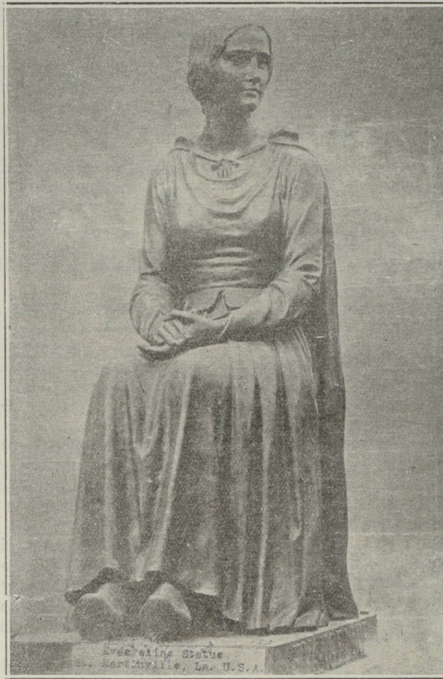
Statue d'Évangéline, l'héroïne acadienne de Longfellow, qui fut dévoilée à St-Martinville, Louisiane, en 1931, en présence de vingt mille spectateurs.

Ces trois principales catégories de gaspésiens de langue française sont: les gaspésiens proprement dits, les