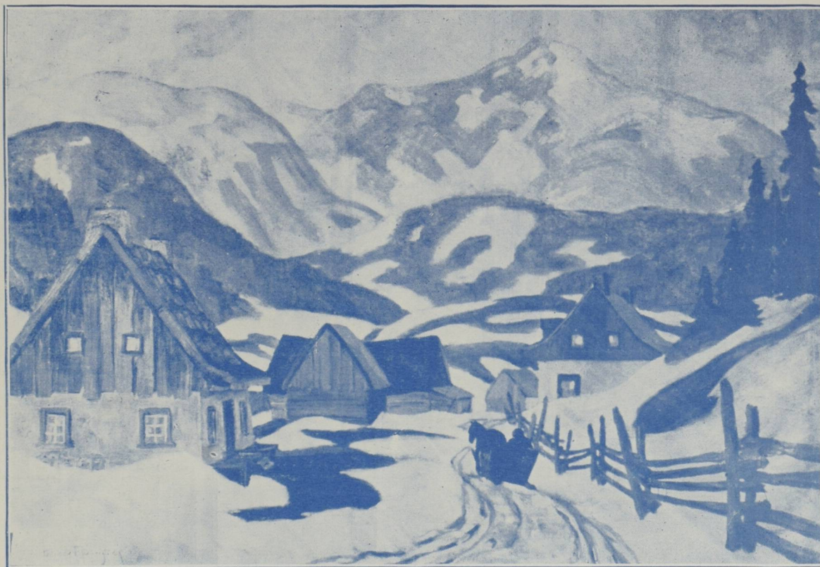
Le printemps, près Saint-Urbain, Charlevoix P. Q.

TABLEAU DE F. E. PFEIFFER, PEINTRE QUEBECOIS.