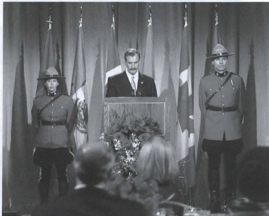
Le président mexicain Vicente Fox prend la parole à l'occasion d'un dîner d'État à Ottawa.

Pour de plus amples renseignements , consultez la page Web suivante : www.international.gc.ca/mexico-city/menu-fr.asp .