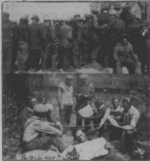
Картина утробі вказує, як одна частина безробітних вистояє в бред-лайн; картина висноє, як гурток безробітних коло бакс-карів гріє воду на чай в бланшанках.

Багато робітників тримають ся це збоку клясової боротьби. Затуманені попами й панями навіть не хочуть добачувати інших причин визиску й економічної кризи понад ті, що за їх говорять пани та їхні локяї.