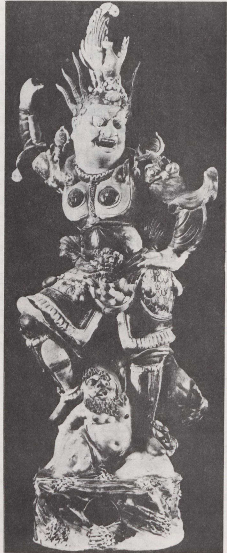
Guardián protector del sepulcro contra malos espíritus, de loza esmaltada en tres colores, correspondiente a la dinastía T'ang, Siglo VIII A.J., excavada en 1959.

blica Popular China, después de haber coronado con éxito sus visitas a París, Londres, Viena y Estocolmo.