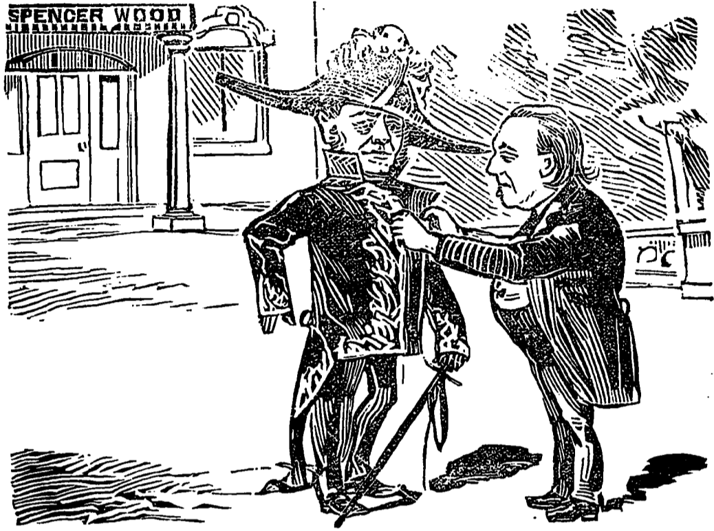
A SPENCER WOOD

"Je prolongeai mon séjour au château où s'était retirée la famille Champgaillard, sous prétexte de la défendre contre les partisans qui infestaient le pays. Ce séjour fut ce qui nous perdit ; Jeanne et moi nous nous voyions souvent en secret, nous nous aimâmes et nous espérâmes un moment que la reconnaissance du baron pour mes services pourrait aller jusqu'à nous unir. Un jour, enfin, je m'enhardis. Je demandai la main de Jeanne. Le baron entra dans une colère terrible et répondit de la manière la plus méprisante. Cependant, comme il était encore mon prisonnier, lui et ses enfants, et, comme après tout, je commandais dans le château, il se calma un peu et me dit : "Si encore vous étiez capitaine d'une compagnie, si vous étiez noble et catholique, peut-être une semblable proposition pourrait-elle écoutée ; mais un petit sergent huguenot, sans nom, sans éducation, sans fortune,