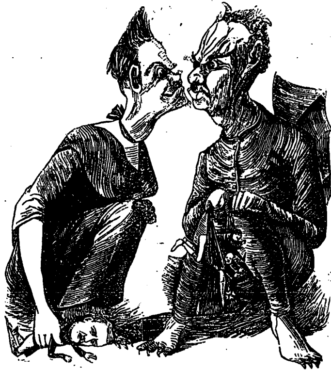
LE DIABLE ET SA FEMME.