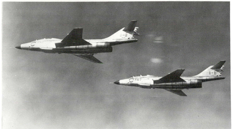
CF-101 Voodoo ▲

Dans le cadre de ce programme modifié, les T-33, avions d'instruction avancée, maintenant désuets, seront remplacés par des CF-5 et on utilisera davantage le CL-41 Tutor, réacteur de formation élémentaire au pilotage, construit par Canadair.