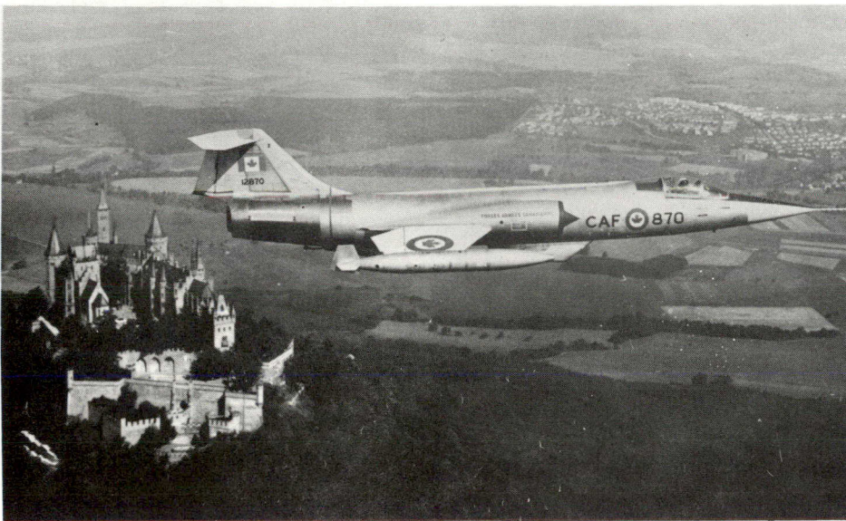
◀ CF-104 Starfighter au-dessus du château Hohenzollern, Allemagne

Les Forces ont besoin d'environ 2,000 pilotes pour remplir leurs divers rôles. Environ 130 pilotes sont diplômés chaque année; en vertu du nouveau programme, ce nombre sera porté à 200.