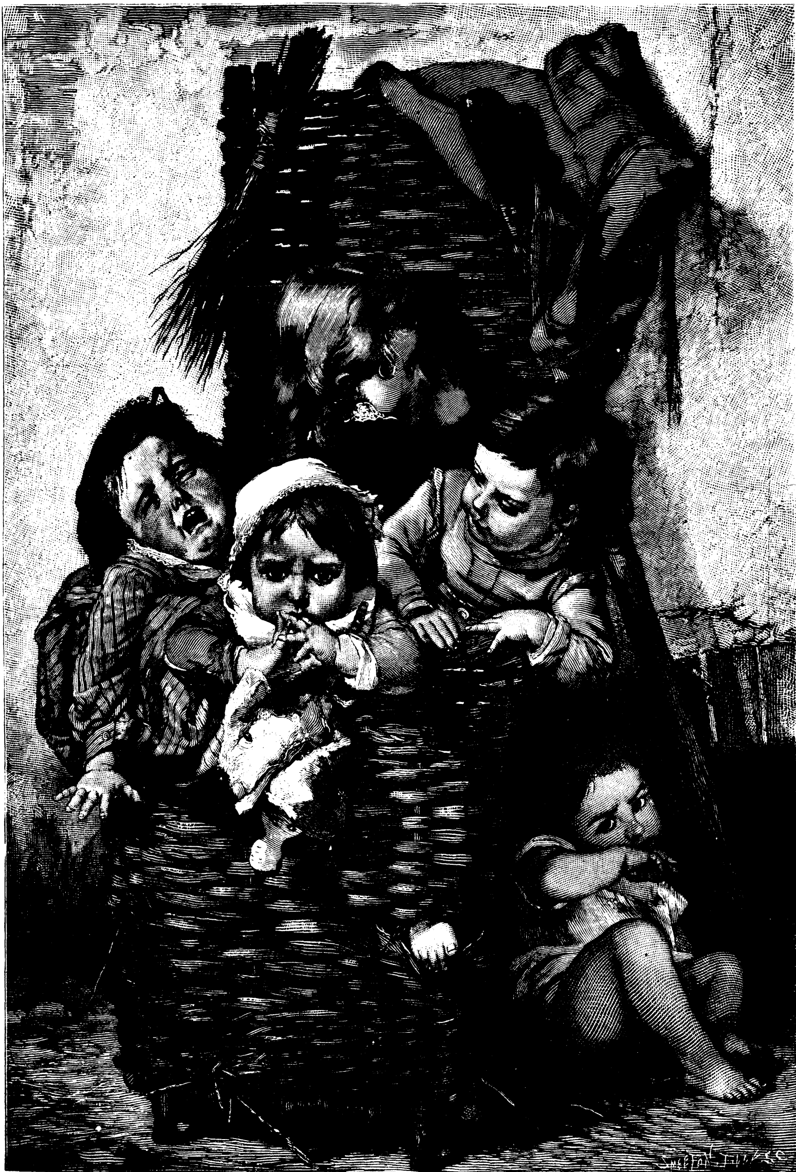
LE BAGAGE DE CROQUETAINE