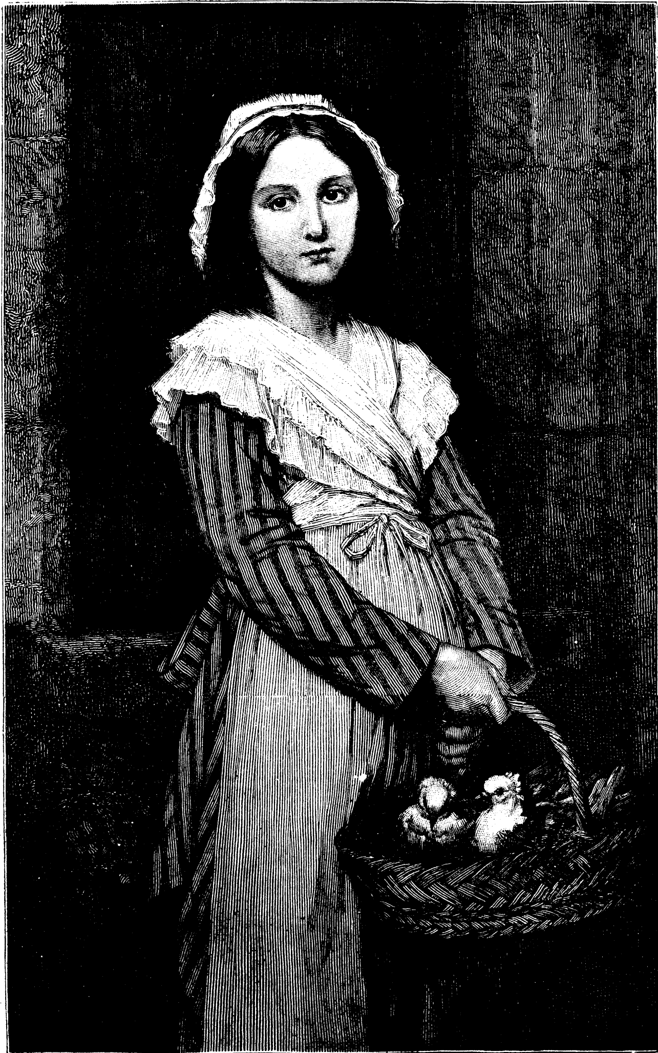
LA PETITE MARCHANDE DE PIGEONS