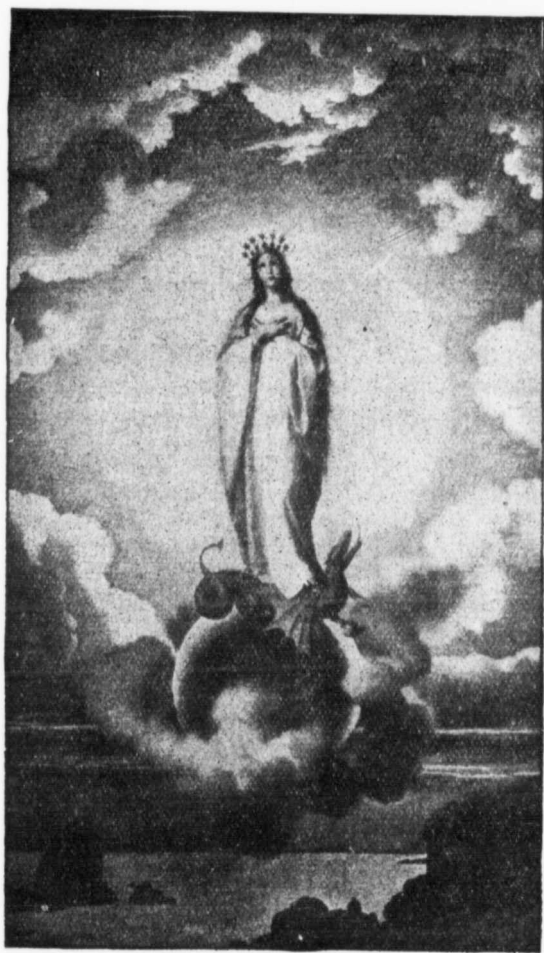
LA VIERGE IMMACULÉE.