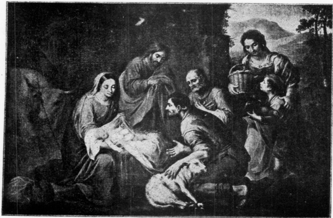
L'ADORATION DES BERGERS.