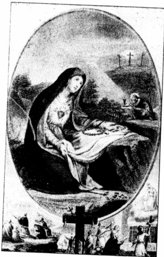
MARIE, REINE DES MARTYRS.