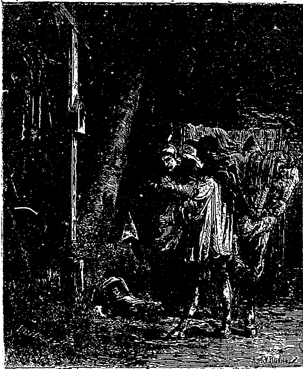
Roch Duboux avait reconnu ceux qui recueillèrent ainsi le nouveau-né. (Page 385).