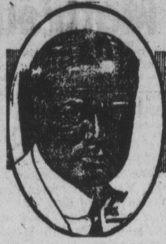
M. Herbert HOOVER républicain.