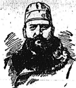
EX-MAYOR DANIEL F. BEATTY.

From a Photograph taken in London, England, 1899.