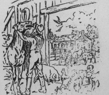
L'AMI DES PAUVRES.

Je suis votre tout dévoué, W. H. DICKSON, 218 rue St. Constant, Montréal. En vente chez C. J. DUBIER, rue Sussex, Ottawa.