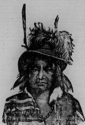
BIG BEAR LE NORD-OUEST

Nous adressons aujourd'hui à nos abonnés une carte topographique des territoires du Nord-Ouest. Cette carte est très-complète, et il leur sera aisé d'y suivre jour par jour la marche des événements qui s'accomplissent actuellement là-bas et qui ont tant d'intérêt pour tous.