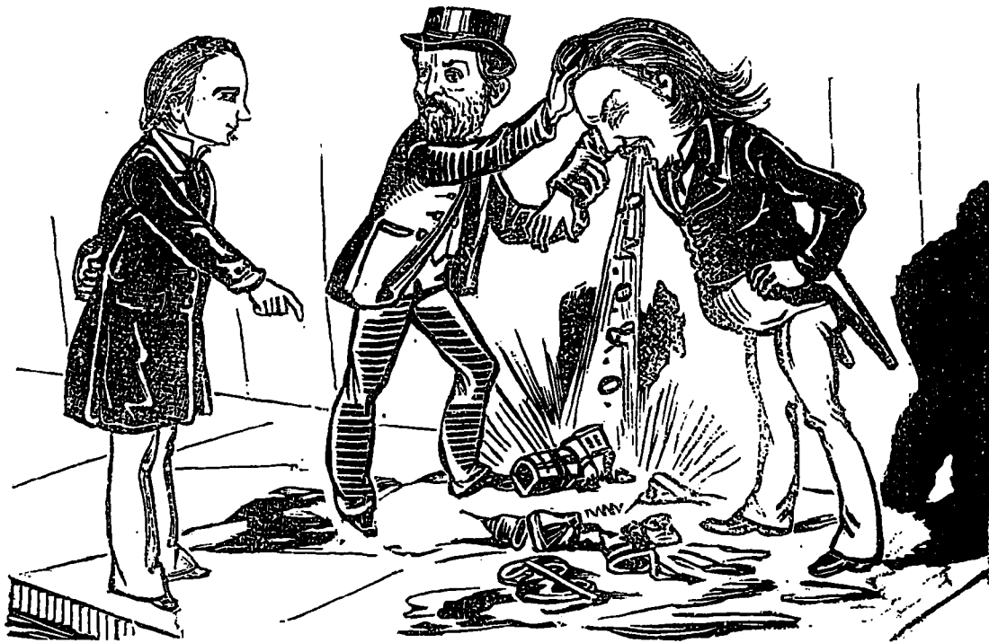
LA CRISE A QUEBEC

SENECAL, FRECHON et Cie. 245, rue Notre-Dame.